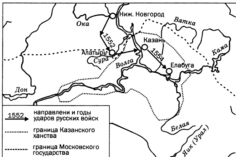
Походы Ивана IV на Казанское ханство

Однако и после этого защитники города не прекратили сопротивление. Поначалу казалось, что взять город удастся довольно легко, но вскоре ситуация осложнилась. Даже ворвавшись в город, русские войска не могли в нем закрепиться, татары выстраивали из подручных материалов все новые