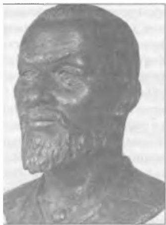
Житель Казани (реконструкция М.М. Герасимова)

Добившись главного, Иван IV мог теперь подкрепить принятый им высокий титул великой заслугой. Не случайно русские источники упорно называют ханство на Средней Волге Казанским царством, подчеркивая таким образом значимость этого государства и сложность его присоединения. Однако это явное преувеличение, потому что, называя правителя Ка-