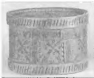
Лукошко чувашских крестьян (XVI в.)

Условия мира были очень жесткими. Для устранения альтернативы Шигалею Иван добился выдачи русским Сююнбеки и ее малолетнего сына Утемиш-Гирея. Шигалей