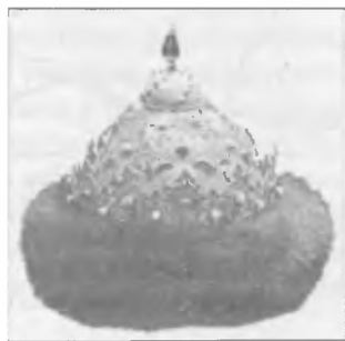
Шапка Казанская (XVI в.)

Самой Казани оставалось только героически погибнуть. Вождем ее защитников и последним казанским ханом стал астраханский царевич Едигер, сумевший с небольшим эскортом проскочить в город мимо русских дозоров. Он отверг предложения русских о мире, понимая, что это всего лишь уловка. Огромная московская армия в августе 1552 г. осадила город, неторопливо готовясь к решающему штурму. Спешно строились туры — осадные башни, подвозилась артиллерия, велись земляные работы. Казанцы неоднократно пытались остановить подготовку к штурму отчаянными атаками извне под командованием мурзы Япанчи и поддержке окрестного населения и ногайцев. Однажды им удалось посеять среди осаждающих панику, которая едва не привела к уничтожению всех результатов подготовительных работ. Однако в августе—сентябре всех, кто пытался помочь обреченному городу, уничтожили: их перебили русские войска под командованием князя Александра Горбатого. Он заманил татарские и ногайские шайки в засаду, из которой те уже не выбрались. После этих сражений сложилась полководческая репутация князя Андрея Курбского и будущего крупнейше-