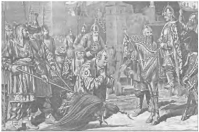
Покорение Казани (литография с картины А.Д. Кившенко)

баррикады. После того как московские войска овладели рубежом бывшего татарского кремля, завязалась жестокая сеча на улицах города. 1 октября отмечался великий христианский праздник (Покров Святой Богородицы), крушение мусульманского государства в этот день наполнилось бы символическим смыслом. Несколько раз русские войска едва не начинали отступление. Бояре впали в панику, несколько раз присылали к Ивану гонцов с просьбой немедленно атаковать силами резервного государева полка, но царь медлил. Иван, будучи неплохим стратегом, прекрасно понимал важность резерва и не торопился, как в свое время Дмитрий Донской, вводить запасные части в неразбериху битвы, выжидая удобного момента для нанесения победного удара.