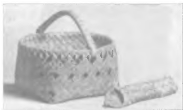
Кузовок и футляр для небольших инструментов (XVI в.)

Приготовления Москвы, существенно отличающиеся от предыдущих попыток взять Казань за счет простого перевеса сил, вызвали у татарских мурз тревогу и желание начать переговоры. Неоднократные дворцовые перевороты свиде-